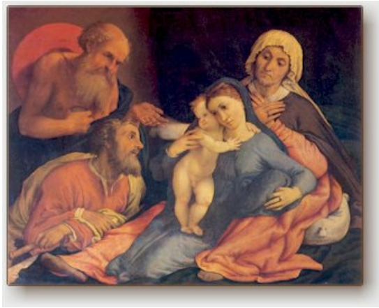
Lorenzo Lotto, Sacra famiglia con i santi Girolamo, Anna e Gioacchino, Firenze, Uffizi, 1534

Altre immagini: 1) Giotto - Il bacio di Anna e Gioacchino: 2) Giotto di Bondone - Annunciazione a Sant'Anna: 3) Tiepolo - Educazione di Maria